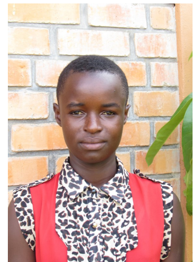
Azaza Alliance Divine 2016